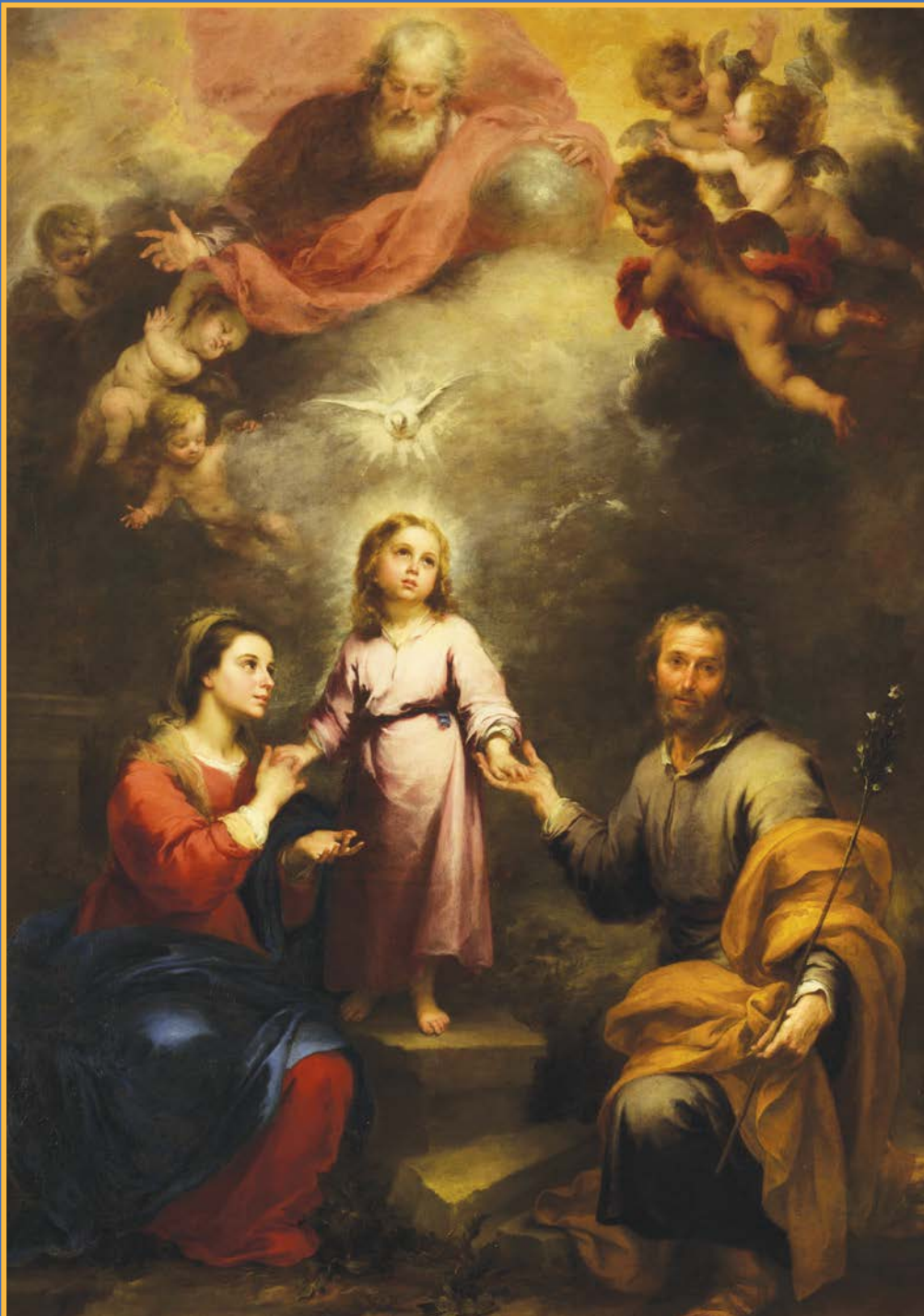
Bartolomé Esteban Murillo, De hemelse en aardse drie-eenheid