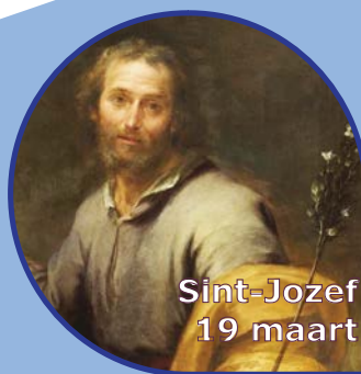
Sint-Jozef 19 maart